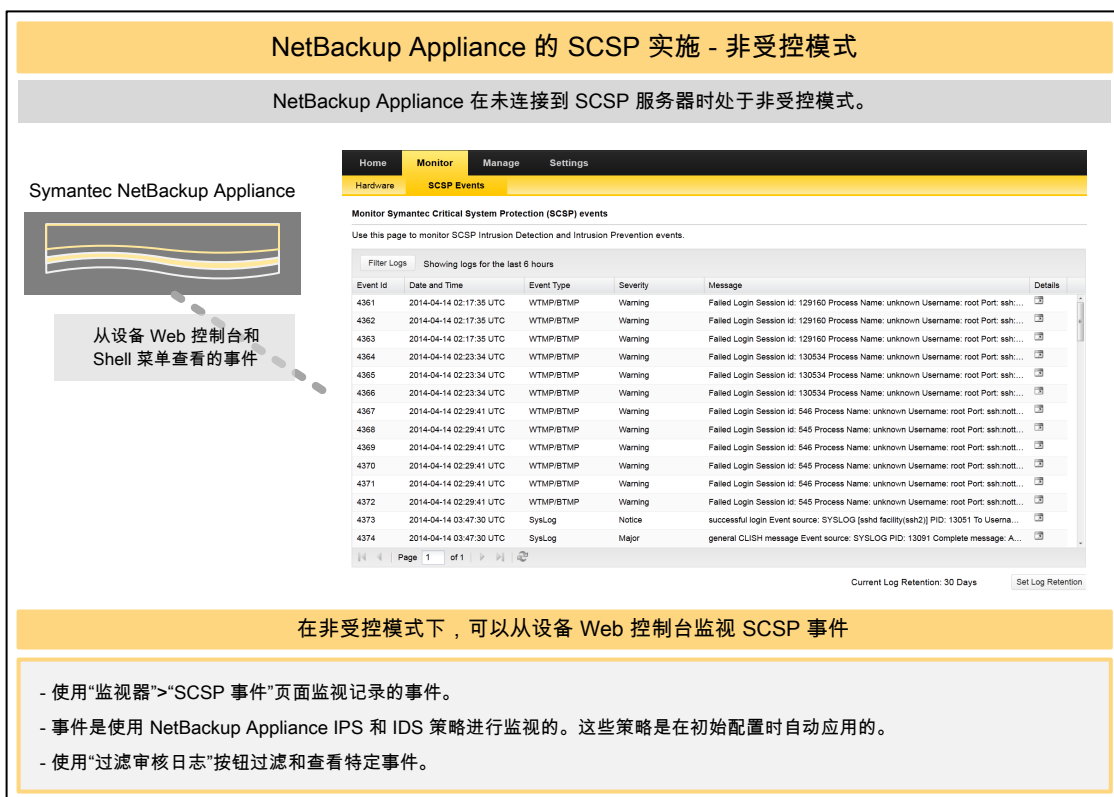
图 4-1 处于非受控模式的 SCSP 实施