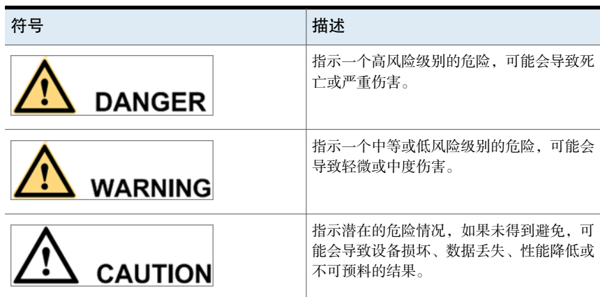
表 1-1 警告符号