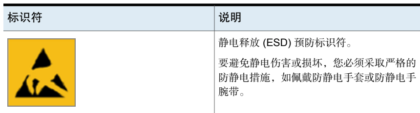
表 1-2 警告和安全性标识符