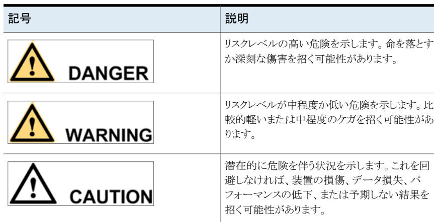
表 1-1 警告の記号

警告の記号は、設置やメンテナンスの作業を行うときに守るべき安全上の注意事項を喚起するものです。