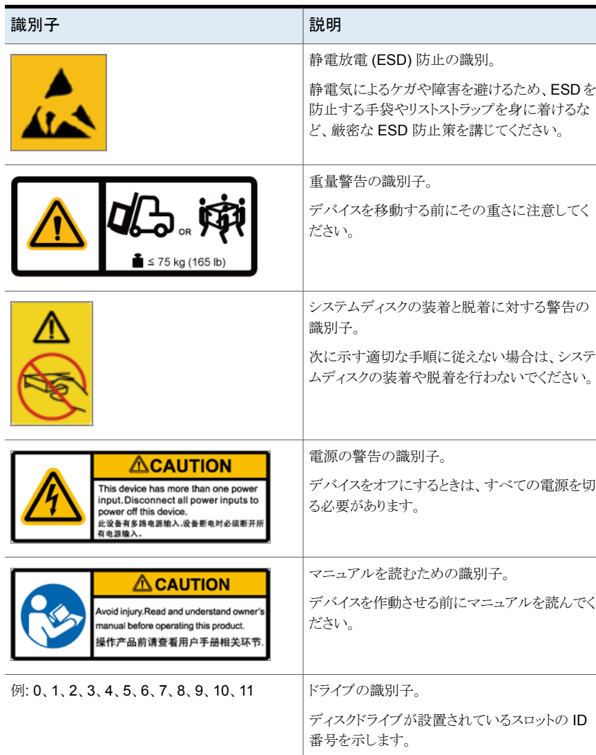
表 1-2 警告と安全の識別子